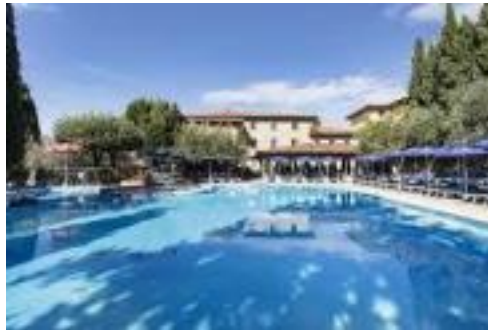
HOTEL VILLA PARADISO ****